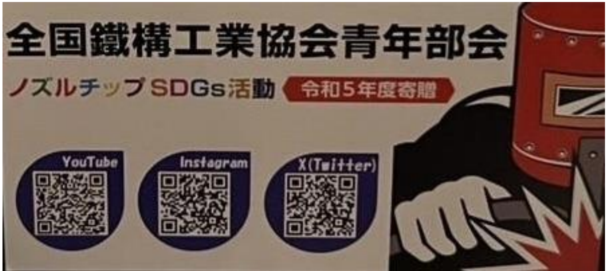
車椅子ステッカー